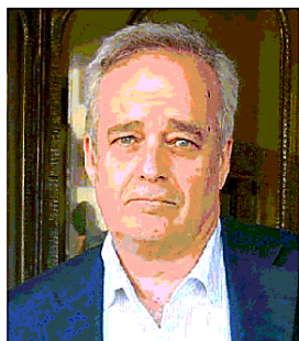
Il senatore Gianclaudio Bressa

Bressa attacca «Strade all'Anas il dietrofront un errore di Zaia»