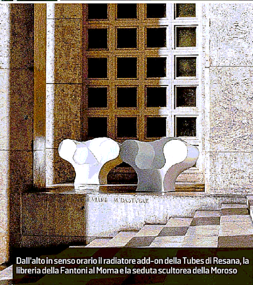
Dall'alto in senso orario il radiatore add-on della Tubes di Resana, la libreria della Fantoni al Moma e la seduta scultorea della Moroso