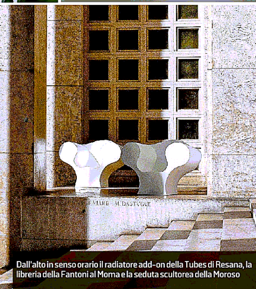
Dall'alto in senso orario il radiatore add-on della Tubes di Resana, la libreria della Fantoni al Moma e la seduta scultorea della Moroso