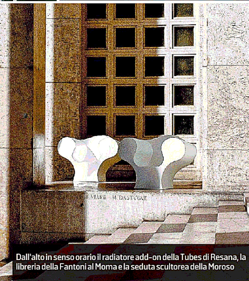
Dall'alto in senso orario il radiatore add-on della Tubes di Resana, la libreria della Fantoni al Moma e la seduta scultorea della Moroso