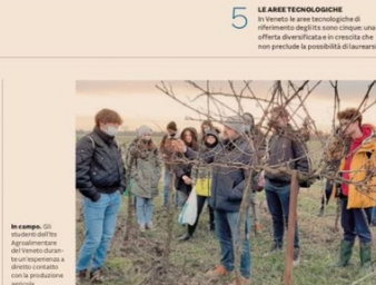
In campo, gli studenti dell'Istituto Agromilano del Veneto durante l'esperienza a diretto contatto con la produzione agricola