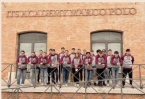
In Formazione. I futuri manager del Marco Polo, l'Academy veneta specializzata in logica portuale e aerospaziale, logica industriale e mobilità sostenibile. A settembre 2022 partirà un nuovo corso

DOCENTI PROFESSIONISTI La Formazione è su 1.800/2 mila euro l'ora, con un corpo docente composto per il 70% da professionisti, e tirocinio formativo, circa 50% dell'ora